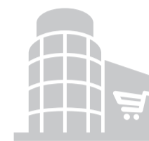
Nehody u obchodních center v krajích (v posledních dvou letech, dle Portálu nehod)